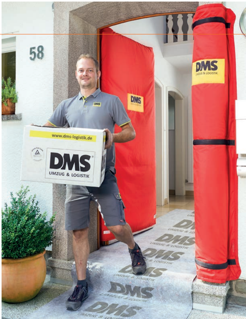
↑ Eckschoner für Ecken und Kanten | Abdeckung für Türen | Bodenvlies