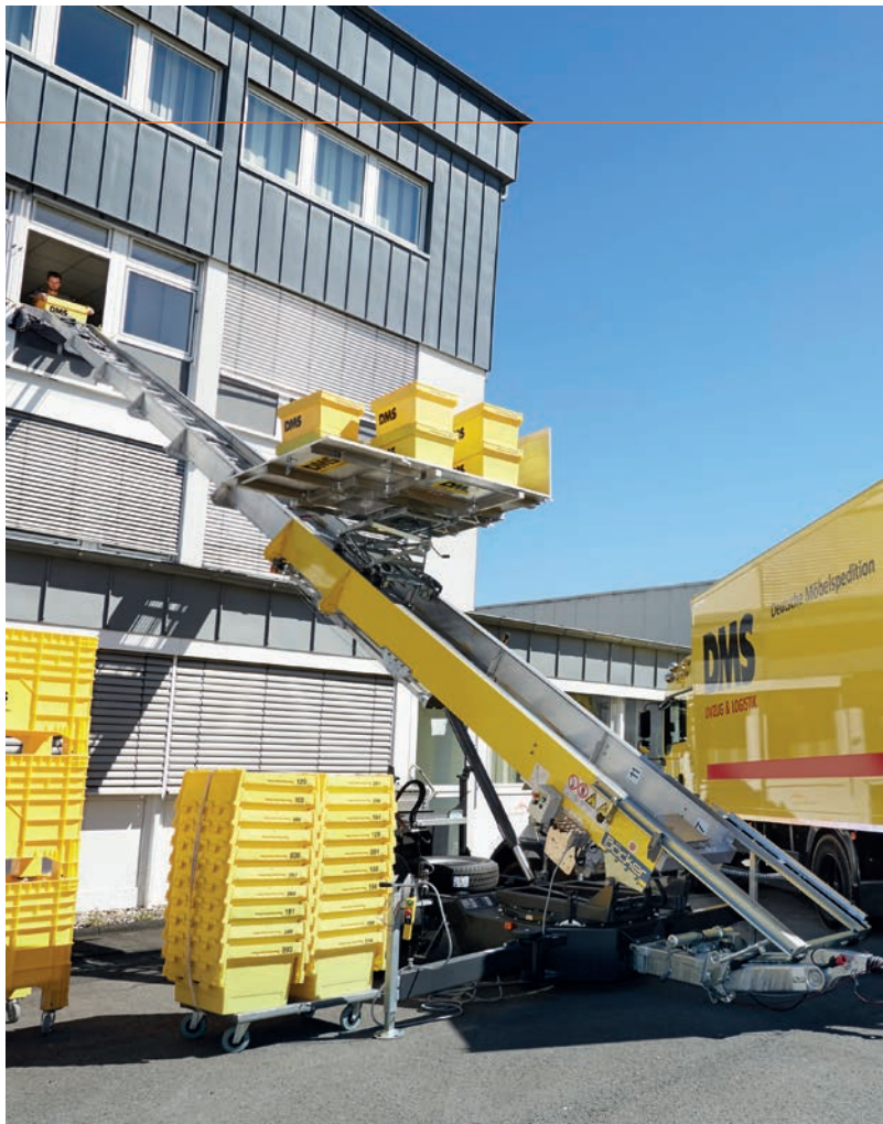
↑ Der Außenaufzug ermöglicht den zügigen Umzug über die Außenfassade