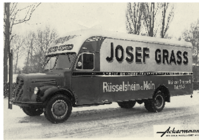
Höhne-Grass – 118 Jahre