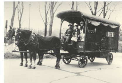
J. & G. Adrian – 152 Jahre